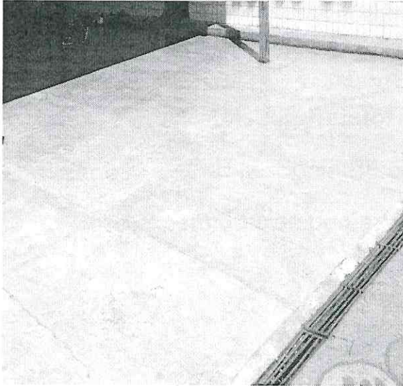
1. Vista do piso do pátio – área descoberta

(raspagem do piso do pátio e refeitório – substituir por resina)