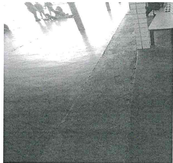
4. Vista do piso – divisa da área do pátio e do refeitório