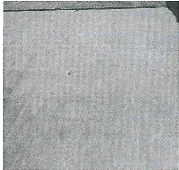
2. Vista do piso do pátio – divisa com parquinho