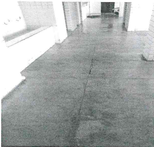
3. Piso escorregadio e manchado – área coberta